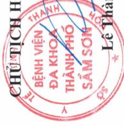
Lê Thành Đồng